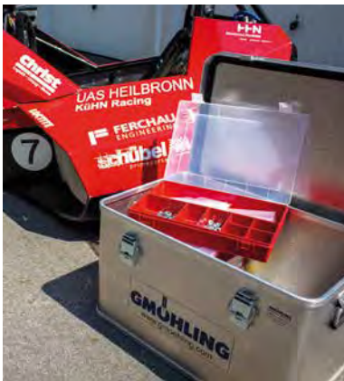
Werkzeugbox für Racing-Team

Gmöhling bietet Ihnen eine Vielzahl von Logistiklösungen. Ob es um die optimale Nutzung der Lagerkapazitäten geht, um den Transport von Gütern oder um einfache Arbeitszyklen, wir haben die Lösung, die genau zu Ihren Anforderungen passt, maßgeschneidert, individuell, innovativ und auf alle Fälle zeitsparend.