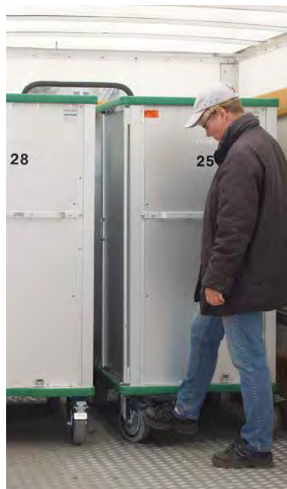
Schrankwagentransport im LKW