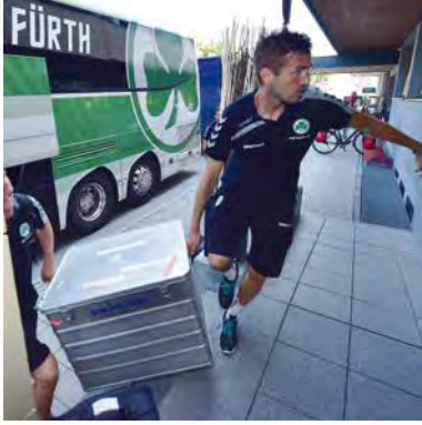
Fußballmannschaft im Trainingslager