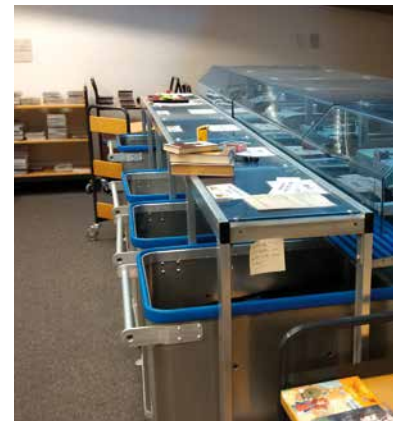
Federbodenwagen in der Bücherei

Wir bringen Bewegung in Ihre Logistik und unterstützen Sie bei der Prozessoptimierung, denn Zeit ist Geld!