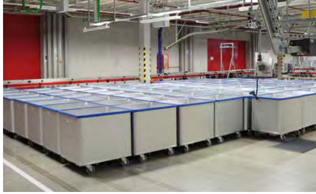
Federbodenwagen im Kommissionslager