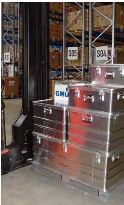
Kisten und Paletten im Hochregallager