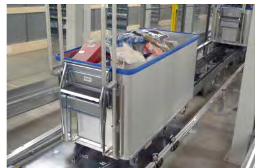
Kommissionierwagen in der Flurförderanlage