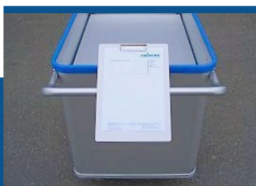
Schreibtafel / Klemmbrett