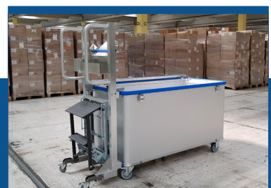
Leiter / Schiebehilfe Getränke- Scannerhalter Etikettenabroller