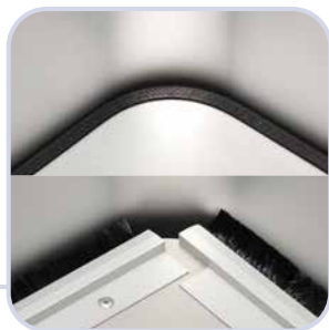
Engeres Spaltmaß mit Auflageplatte oder Bürstenleiste