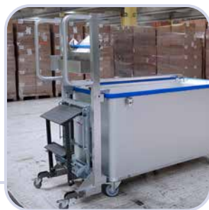
Leiter, Schiebehilfe, Getränke-, Scannerhalter, Etikettenabroller, Schreibtafel oder Klemmbrett